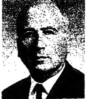
يقلم : والتر ايتان

وفي ايماننا نجد ان الاتحاد السوفياتي يقوم بصفتها عسكرية عدوانية على فترات اند كل منها اثنا عشر عاما . ففي ١٩٤٤ انجز الاتحاد السوفياتي احتلاله وسيطرته على شرقي اوربا ، ولم يبق امام روزفلت وشروشل غير التبول في بالطا . « لفرى بسند سيطرته على اوربا الشرقية ، فقد رفض الاتحاد السوفياتي في مؤتمر بالطا الالتزام بالاتحاد بالحرب ضد اليابان » . وبعد مرور اثني عشر عاما بالتحديد سخر الاتحاد السوفياتي قوات ضخمة الى شرق افريقيا ليرفض على تلك البلاد حكومة تخضع لسياسة موسكو . وبعد مرور اثني عشر عاما من ذلك في عام ١٩٦٨ ، اقتصد الاتحاد السوفياتي خسارة مائة مائة مليون دولار في تشيكوسلوفاكيا ، وظلت قواته تحتل تلك البلاد الى يومنا هذا ، تصعب اخيرا على تلك ، وما تمن تجد الاتحاد السوفياتي في عام ١٩٨٠ يسيطر على افغانستان التي انفسانت ليطالبها بالحد والفر ، ضد رغبة شعبها . ومن سبق الزمان التكن بما قد يحدث في عام ١٩٩٢ .